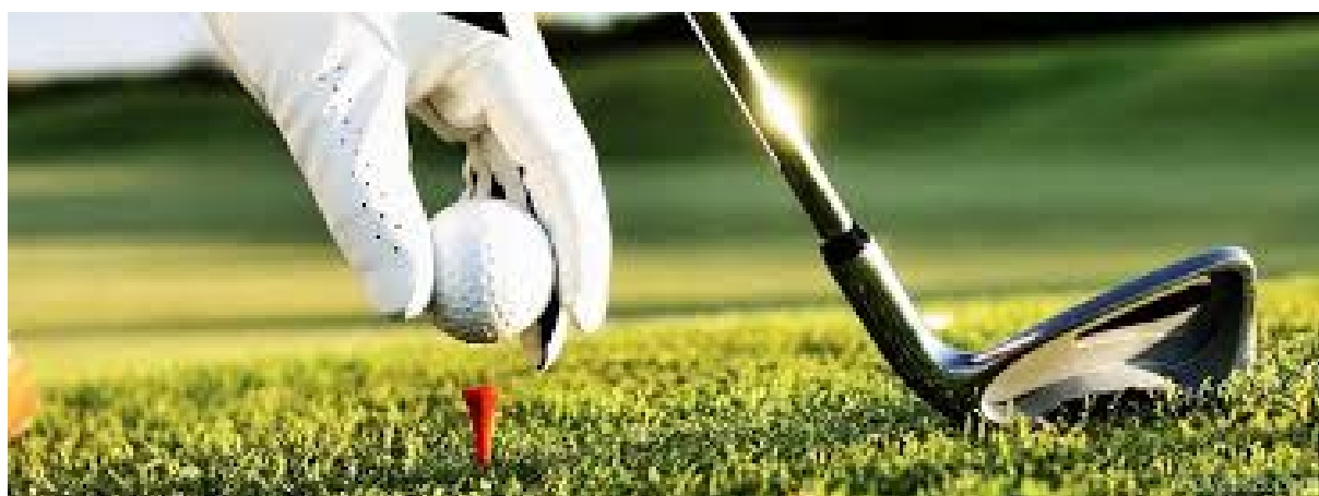
Obr. Umístění míčku na týčko na odpališti